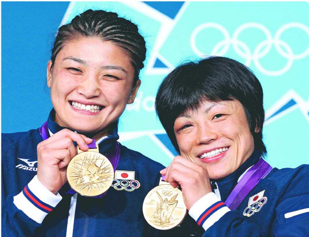
金メダルを手に喜ぶ伊調馨(左)と小原日登美(右)8日、エクセルで

伊調 馨(いちよう・かおり) 2004年アテネ、08年北京両五輪63キ級で2連覇。北京後に休養し、09年に復帰。昨年9月の世界選手権で2年連続7度目の優勝。姉の千春さんはアテネ、北京の48キ級銀メタリスト。中京女大(現至学館大) 出。166キ。青森県出身。28歳。