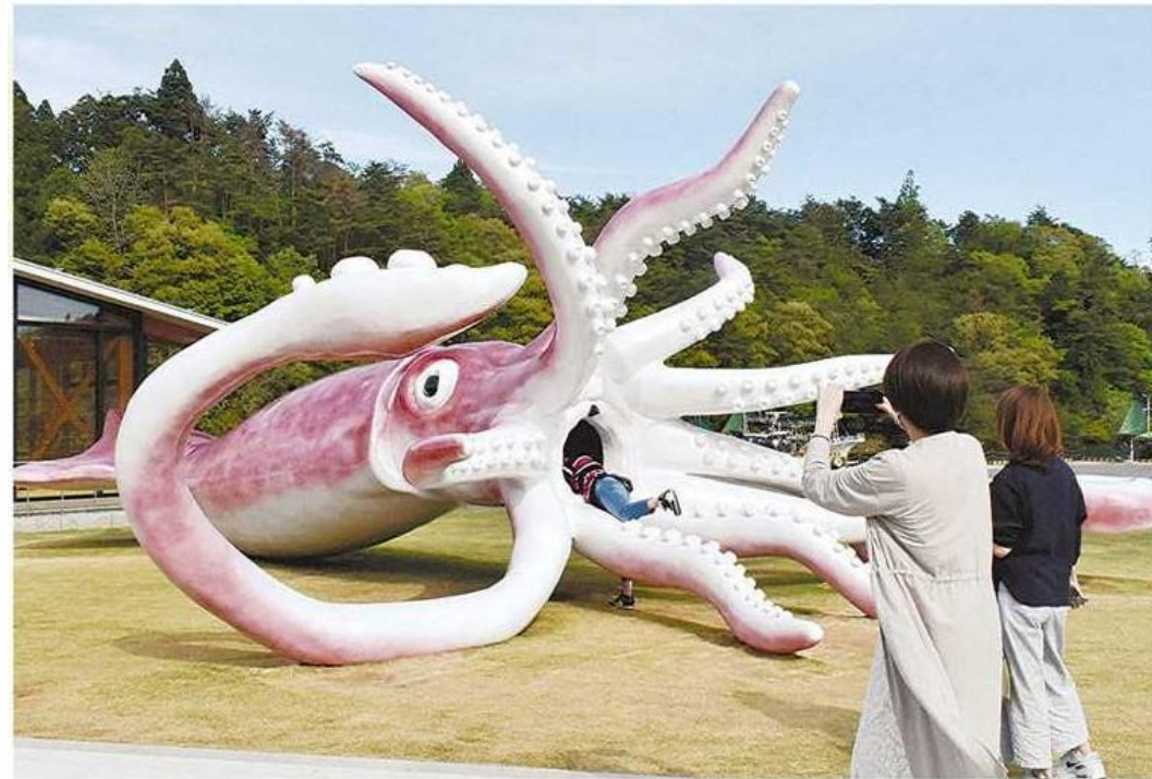
「イカの駅つくモール」にできた巨大なイカの像＝石川県能登町で

石川県能登町にある全長13mの大きなスルメイカの像が、世界の注目を集めています。新型コロナウイルスへの対策として、町役場が3千万円の税金をかけて、この像を作ったことが驚かれています。 能登町にある小木港はスルメイカの漁が盛んなところで、水揚げ量は日本有数の多さです。特産のスルメイカをPRし、観光に訪れたいのために像を作りま