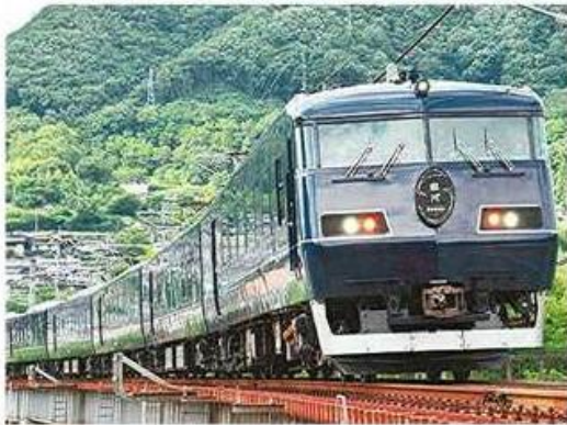
「WEST EXPRESS 銀河」

JR西日本は十六日、特別急行列車「WEST EXPRESS 銀河」を来年の夏から秋にかけて、京都-新宮間で運行すると発表した。新宮行きは夜行、京都市行きは昼の列車として運行する。具体的な時期や時間、料金は決まり次第、公表する。 JR西日本によると、沿線の自治体から要望があったことなどから実現した。