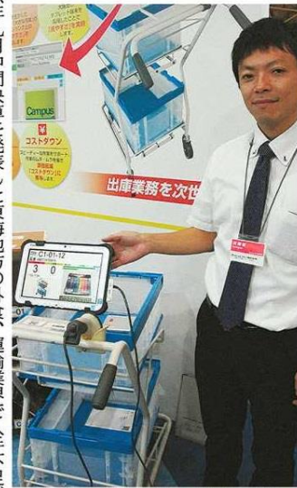
タブレット端末を取り付け、効率的に運べるように工夫した手押しカート＝名古屋市港区で

二〇一六年九月中間決算を発表した東海地方の外食、運輸業界で人手不足が続いている。ITを活用して業務を効率化することで店舗の経費を減らしたり、従業員の離職を防いだりする工夫も出始めた。