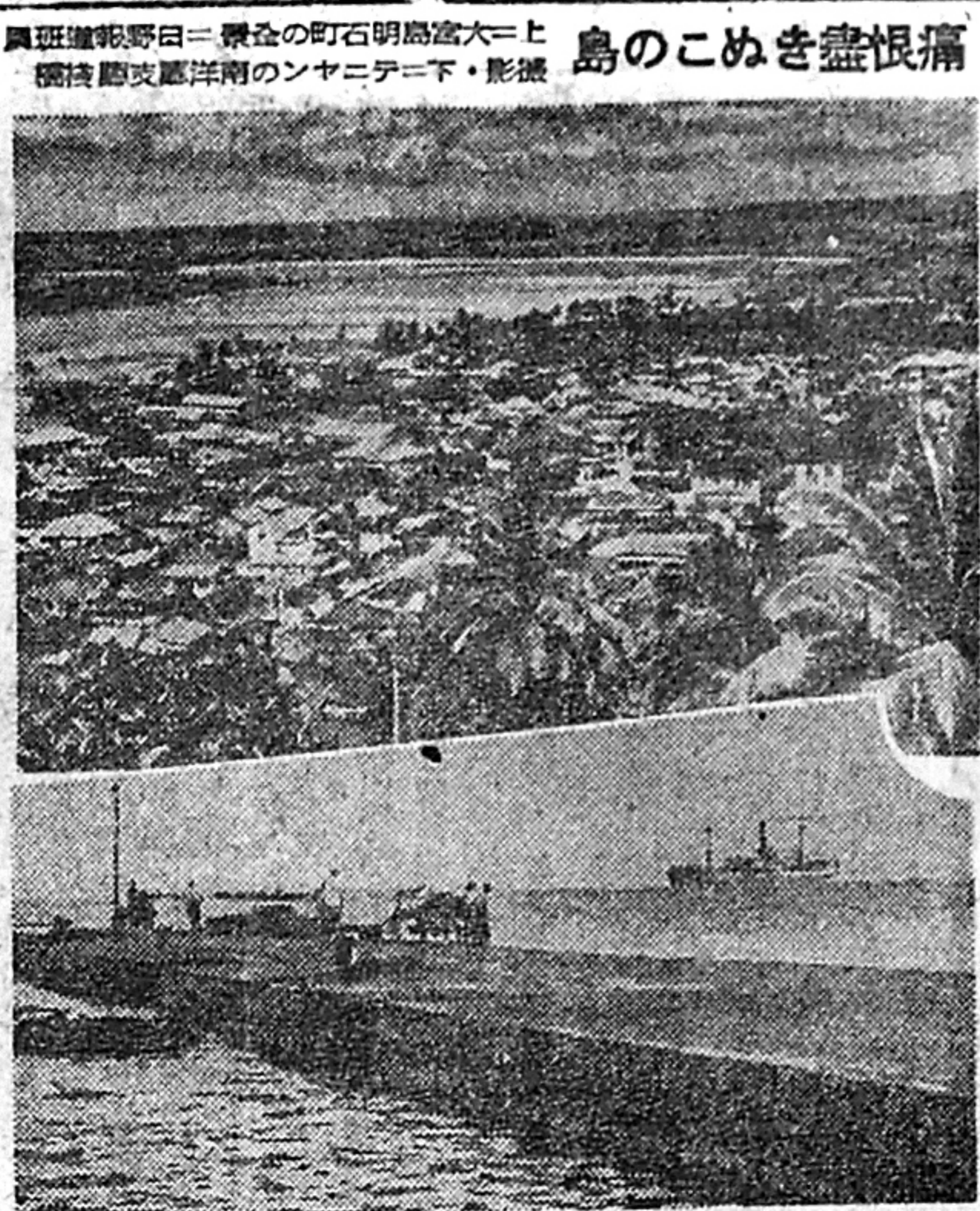
島のこめき盡恨痛